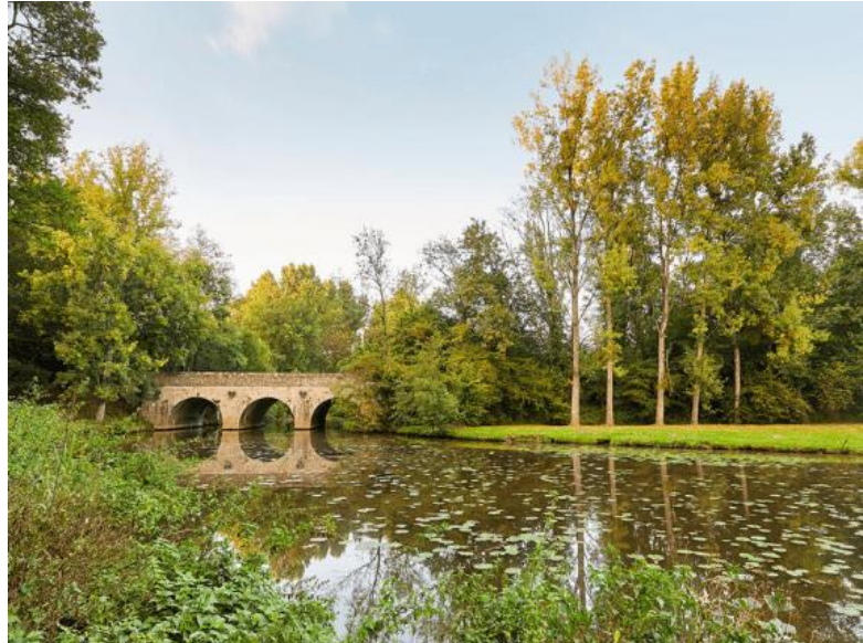
Alexandre Lamoureux – Vendée Expansion