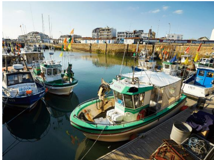
Alexandre Lamoureux – Vendée Expansion

foodtruck Le Banc des Sardines . Filez ensuite l’aventure vers un trajet bucolique et nature en longeant les dunes du Jaunay et rejoignez les marais de Givrand. Savourez la quiétude et les paysages verdoyants en poursuivant votre chemin vers Saint Révérend. Visitez le Moulin des Gourmands (sur réservation) et testez les biscuits au sarrasin version salée ou sucrée.